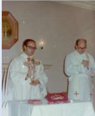
15 dez 1973 Celebração Natal