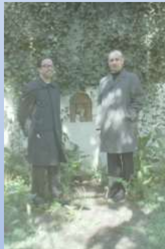
fev 1974 Visita P Jakel