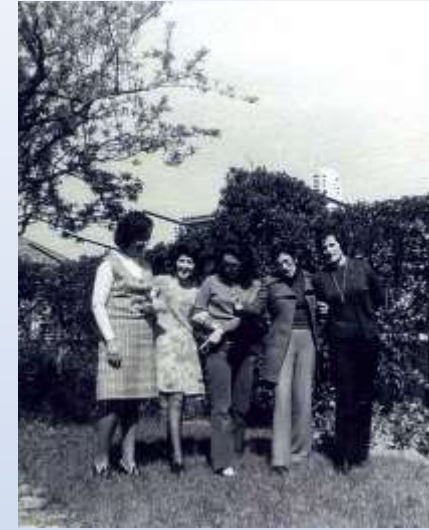
1974 Grupo "Segues-me?"